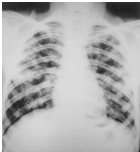
Figura 1 Radiografia de tórax em PA evidenciando nódulos pulmonares bilaterais