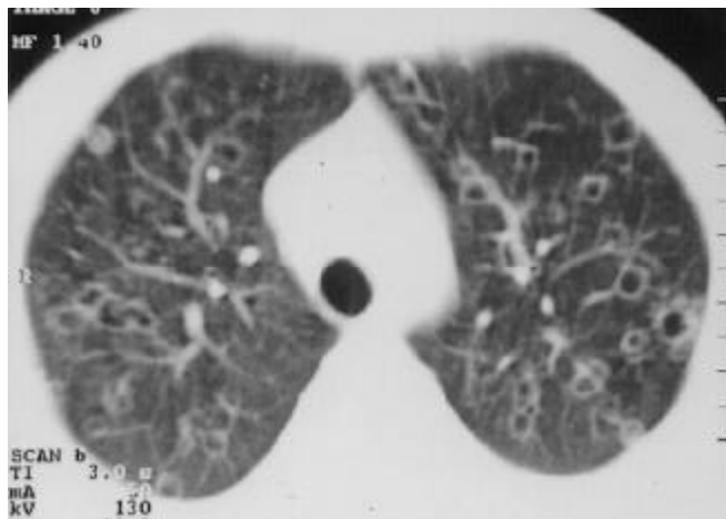
Figura 2 – Tomografia computadorizada de tórax mostrando nódulos, alguns com cavitações de paredes finas bilaterais guardando relação com vasos pulmonares, sugerindo disseminação hematogênica da infecção

para HIV (método ELISA), ambas negativas. Fez uso de oxacilina e gentamicina, tendo sido associado itraconazol ao esquema devido à persistência de febre. Recebeu alta com remissão do quadro clínico e radiológico.